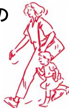
イラスト 安藤由紀